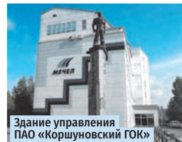
Здание управления ПАО «Коршунковский ГОК»