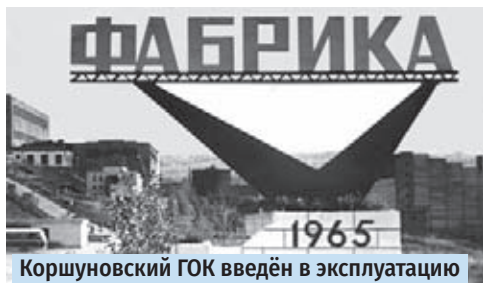
Коршунковский ГОК введён в эксплуатацию