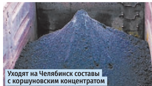
Уходят на Челябинск составы с коршунским концентратом