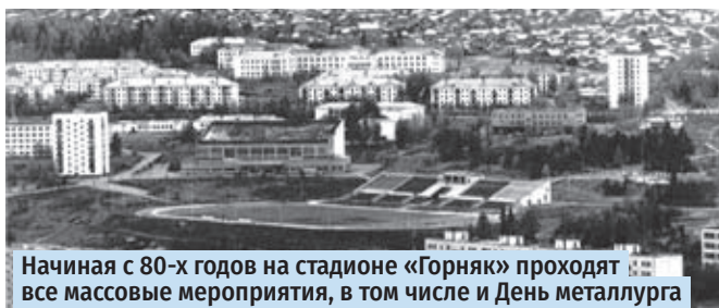
Начиная с 80-х годов на стадионе «Горняк» проходят все массовые мероприятия, в том числе и День металлурга